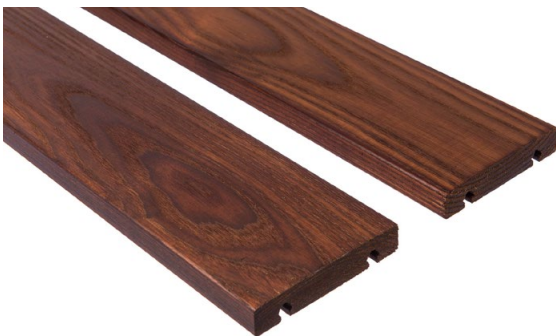
Thermory Ash D45J, 21 x 118 mm

D45J-terassilautojen tausta on uritettu ja yläpinta hieman pyöristetty, jotta vesi valuu laudan päältä pois.