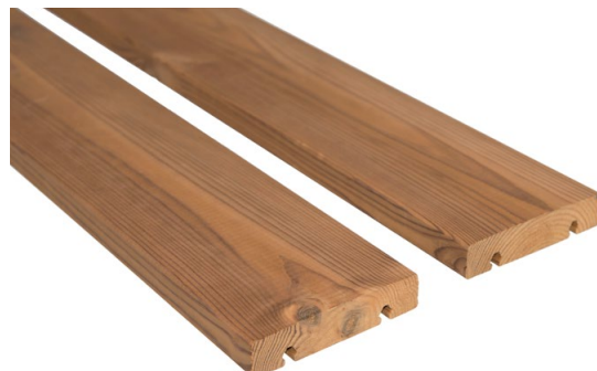
Thermory Pine D45J, 26 x 118 mm