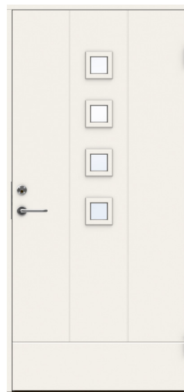
Dörr med 4 glas 10x21 u-värde 0,8