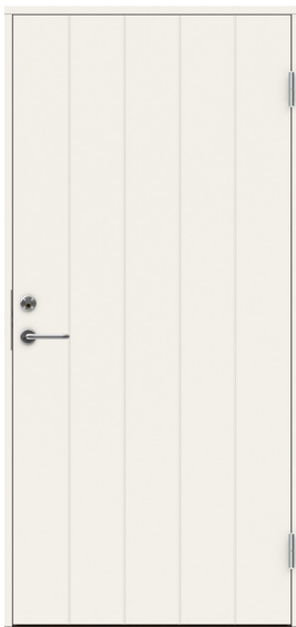
Tät dörr 10x21 u-värde 0,8