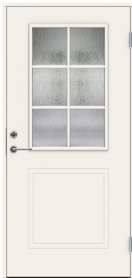
Dörr med 6 glas 10x21 u-värde 1,1