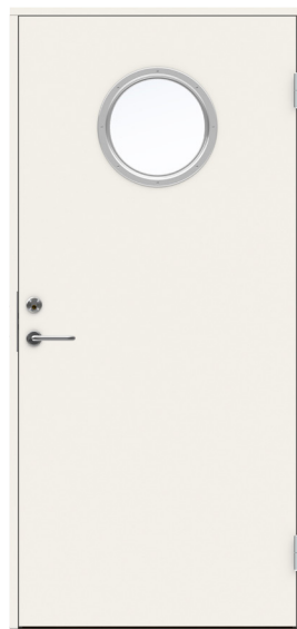
Dörr med runt glas 10x21 u-värde 0,8