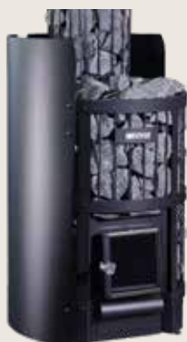
Kiukaan suojaseinä WL200