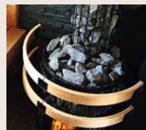
Legend suojakaide SASPO240