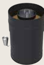
Teräspiipun savupelti WHP270SPM