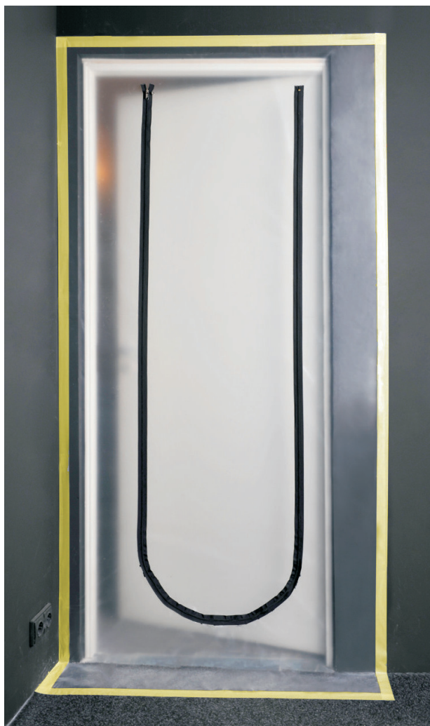
Dammskyddet ger en tät anslutning mot rum som renoveras.

Art nr: Benämning: Dimension: 199002 Dammskydd för dörr 1200 x 2300 mm